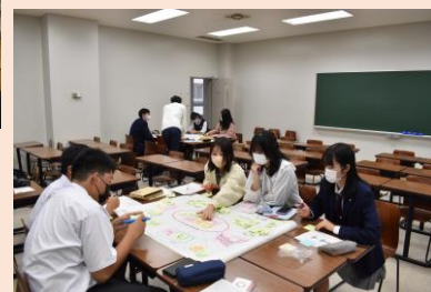
ワークショップの成果を発表。参加者全員が「持続可能な都市 名古屋」を考えました。