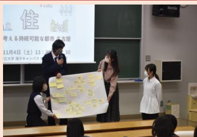
高校生と大学生が共同でワークショップに取り組みました。

今年度は「住」をテーマに集まった高校生と大学生がグループに分かれて、「住から考える持続可能な都市 名古屋」について日頃の学びや研究をもとに話し合い、その結果を発表し合いました。参加者全員が持続可能な社会の実現に向けて当事者意識を持って何ができるのかを考えました。参加した高校生・大学生にとって、互いの学びや研究を共有する有意義なひとときとなりました。