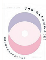
講師 高橋 康史